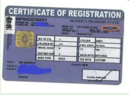
హైదరాబాద్, భారత శక్తి ప్రతినిధి, జనవరి 26: తెలంగాణ ప్రభుత్వం వాహన రిజిస్ట్రేషన్ విధానంలో కొత్త పద్ధతి అమలులోకి తెచ్చింది. ఇటు వాహనదారులకు, అటు రవాణా అధికారులకు ఇద్దరికీ మేలు జరిగేలా నూతన విధానం

నుంచి అమలులోకి వచ్చింది. వాహనం కొన్న చోటే రిజిస్ట్రేషన్ చేసే విధానం ప్రవేశపెట్టింది. మాదాపూర్ రవాణా కార్యాలయంలో నిర్వహించిన బ్రయల్ రన్ విజయవంతమైంది. దీంతో రాష్ట్రమంతా అమలులోకి తెచ్చింది. కొత్త వాహనాలు కొనుగోలు చేస్తే ఇకపై ఆర్టివో కార్యాలయాల్లో క్యూలు, చక్కరలు అవసరం లేదు. డీలర్లు ఫోటోలు, డాక్యుమెంటు ఆన్ లైన్ లో నమర్చించి నంబర్ కేటాయిస్తారు. డీలర్లు ఇన్ వాయిస్, బీమా, చిరునామా ప్రువీకరణ, వాహన చిత్రాలు అప్ లోడ్ చేస్తారు. అధికారులు డిజిటల్ పరిశీలన తర్వాత ఆమోదం ఇస్తారు. ఆర్టీ కార్డు చిరునామాకు పోస్ట్ అవుతుంది. అవసరమైతే షోరూమ్ లో తనిఖీ జరుగుతుంది. అయితే కొత్త విధానం ద్వితీయ, నాలుగు చక్రాల వాహనాలకు మాత్రమే. వాణిజ్య వాహనాలు ఆర్టివోలోనే చేసుకోవాలి. ఆర్టివోలో స్టాప్ బుకింగ్, వేచి ఉండటం ముగిసిపోతుంది. కొనుగోలు రోజు సాయంత్రానికి