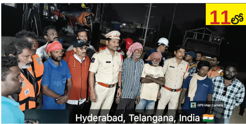
Hyderabad, Telangana, India 11 లో