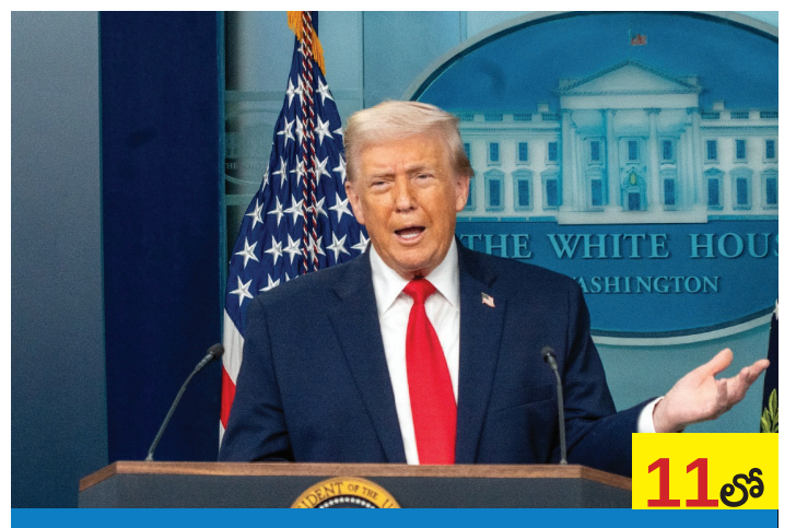
భారత్తో మాది చారిత్రక బంధం: లిపజ్జిక్ డే సుభాకాంక్షలు తెలిపిన ట్రంప్ 11 లో

Published from Hyderabad, Kadapa, Guntur, Kurnool, Khammam, Vijayawada & Warangal