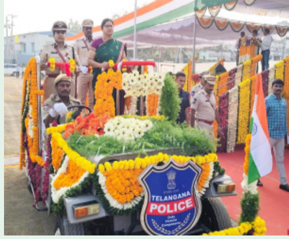
నృత్యాధికారులు, పోలీసు అధికారులు, సిబ్బంది తదితరులు పాల్గొన్నారు.