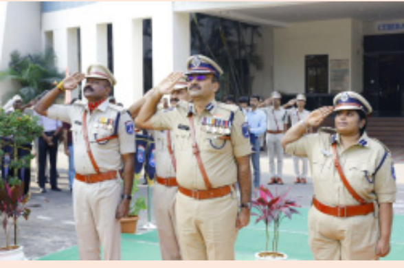
ప్రజల చేత ఎన్నికైన ప్రతీనిధుల ద్వారానే నిర్వహిస్తున్నారని, ఇదే ప్రజాస్వామ్యానికి పునాదని పేర్కొన్నారు. పోలీస్ సిబ్బంది కూడా రాజ్యాంగ పరిమితుల్లోనే తమ విధులు నిర్వహిస్తున్నారని తెలిపారు. బడుగు, బలహీన వర్గాలు, మహిళా సాధికారత, మహిళల ఓటు హక్కు వంటి హక్కులను రాజ్యాంగమే కల్పించిందన్నారు. ఆసియా, ఆఫ్రికా, యూరప్ సహా పలు దేశాల్లో రాజకీయ అస్థిరతలు, తిరుగుబాటు కనిపిస్తున్నప్పటికీ, భారతదేశం సురక్షితంగా

భారత రాజ్యాంగం వల్లే ప్రతి పౌరుడికి ప్రాథమిక హక్కులు లభిస్తున్నాయని సీపీ తెలిపారు. రాజ్యాంగబద్ధమైన పదవులన్నీ